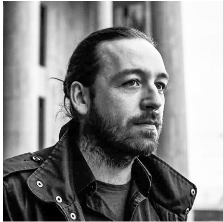
Ο διευθυντής φωτογραφίας, Ρόμπερτ Μάλι

Γεννήθηκε στη Βουδαπέστη το 1982. Ξεκίνησε την καριέρα του ως μοντέρ πριν σπουδάσει Σκηνοθεσία στο Πανεπιστήμιο Γουεστμίνστερ του Λονδίνου. Έχει δουλέψει στη Βουδαπέστη και στο Λονδίνο, σκηνοθετώντας μικρού μήκους ταινίες και επεισόδια τηλεοπτικών σειρών. Το 2022 κυκλοφόρησε η πρώτη μεγάλου μήκους ταινία του, "The grandson" (Ο εγγονός).