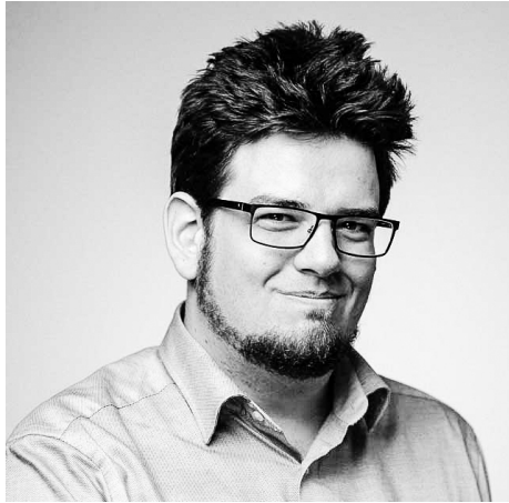
Ο σκηνοθέτης της ταινίας, Κριστόφ Ντεάκ

Γεννήθηκε στη Βουδαπέστη το 1982. Ξεκίνησε την καριέρα του ως μοντέρ πριν σπουδάσει Σκηνοθεσία στο Πανεπιστήμιο Γουεστμίνστερ του Λονδίνου. Έχει δουλέψει στη Βουδαπέστη και στο Λονδίνο, σκηνοθετώντας μικρού μήκους ταινίες και επεισόδια τηλεοπτικών σειρών. Το 2022 κυκλοφόρησε η πρώτη μεγάλου μήκους ταινία του, "The grandson" (Ο εγγονός).